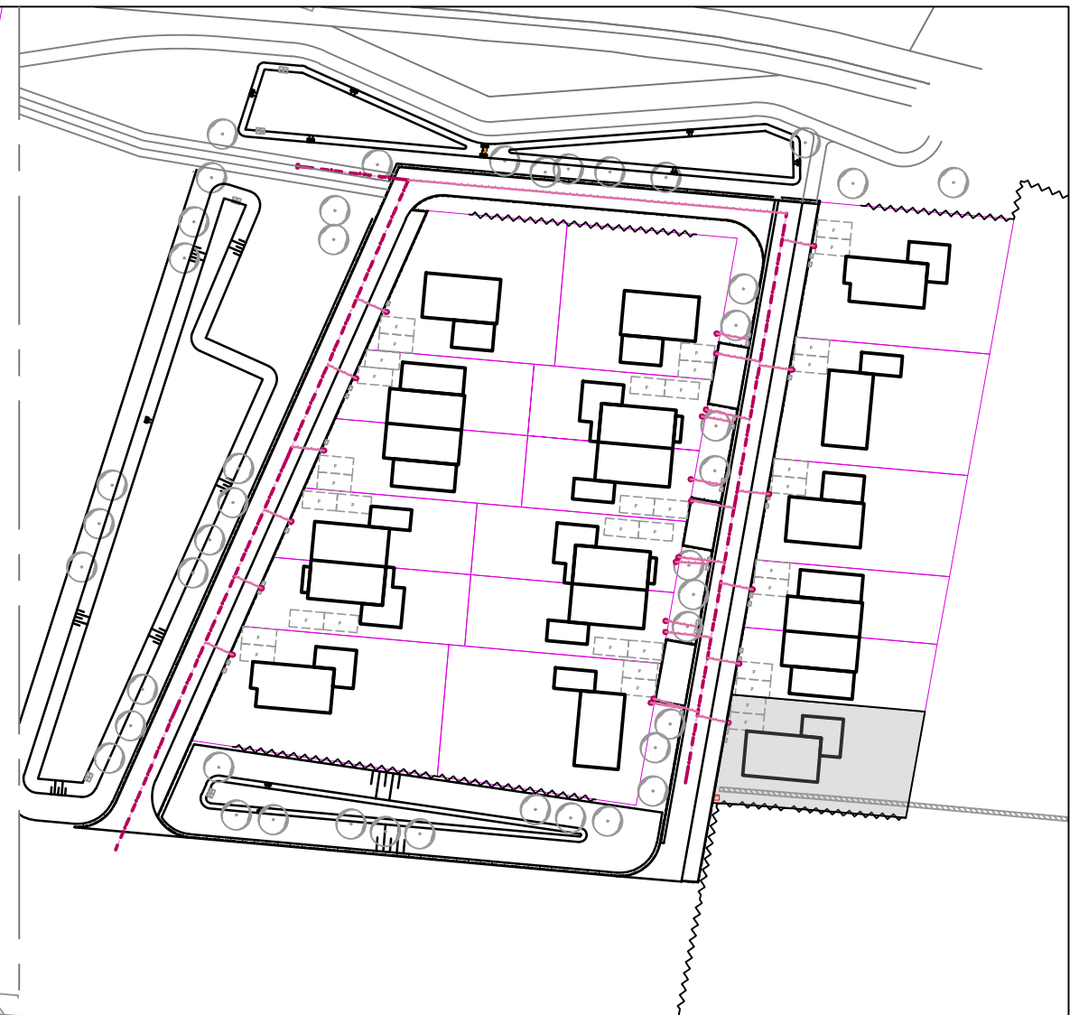
Overzicht situatie schaal 1:1000